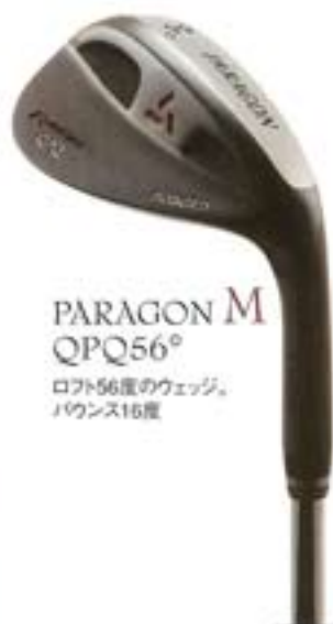
M PARAGON M QPQ56° ロフト56度のウェッジ、 バウンス15度