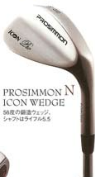
N PROSIMMON ICON WEDGE 56度の鍛造ウェッジ、 シャフトはライフル5.5