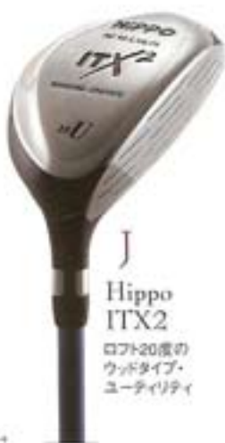
J Hippo ITX2 ロフト20度の ウッドタイプ、 ユーティリティ