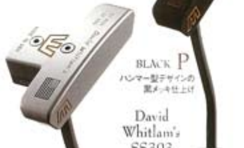
P BLACK P ハンマー型デザインの 黒メッキ仕上げ