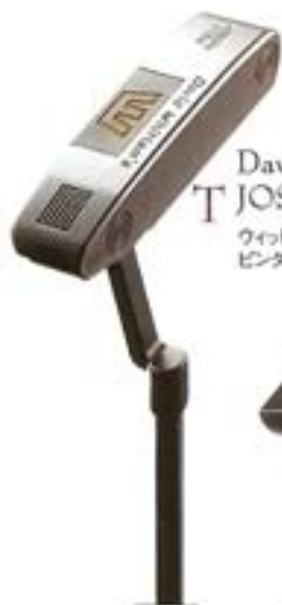
T David Whitlam's JOSEPH ETBW ウィットラム/バターの ピンタイプ