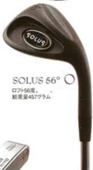
S SOLUS 56° ロフト56度、 総重量457グラム