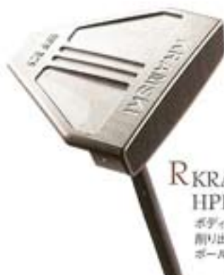
R KRAMSKI HPP325 ボディはステンレス 削り出し、 ボールピックアップ付き