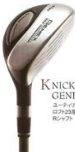
K KNICKENT GENEX ユーティリティの4番、 ロフト23度、 Rシャフト