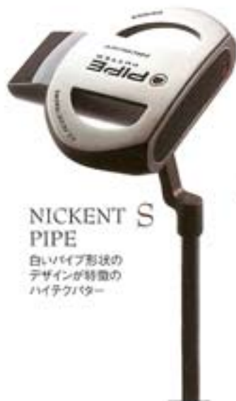
S NICKENT S PIPE 白いパイプ形状の デザインが特徴の ハイテクバター