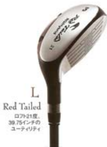
L Red Tailed ロフト21度、 39.75インチの ユーティリティ